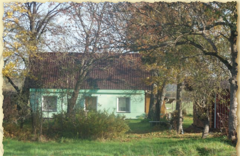
Pritsu talu aastal 2010