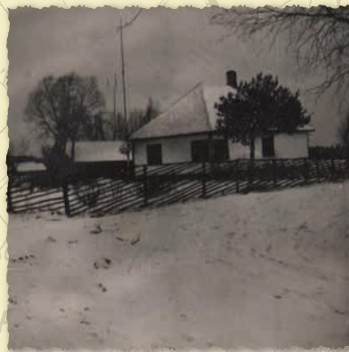
Lippingu talu 1950ndatel