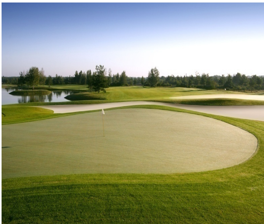
Kuressaare golfiväljak. Rahandusministeerium ega Riigihangete Amet ei ole analüüsinud, kas Saaremaa Golfi AS oleks väljaku ehitamisel pidanud korraldama riigihankeid.