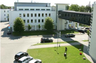
Taastusravikeskus Estonia on aastaid olnud üheks kuurortlinna Pärnu sümboliks.

24. Saaremaa Golfi ASi golfiväljak asub Kuressaare linna munitsipaalomandisse antud maal, mis Kuressaare linna taotluse kohaselt oli vajalik linna arenguks. Linna arengukavas 2005–2013 on linna arengu ühe olulise osana kirjas luua golfiväljaku rajamiseks eeldused ja rajada see linna loodud ettevõtja poolt. Enne Saaremaa Golfi ASi (varasema nimega AS Kuressaare Golfipark) asutamist sai linn erinevatest programmidest golfiarenduseks 4,5 miljonit krooni. Maale moodustatud kinnistutega tegi Kuressaare linn mitterahalise sissemakse Saaremaa Golfi ASi. Äriühing on osa neist elamumaana müünud, et rahastada oma tegevust. Ka edaspidi on linn teinud ettevõtte aktsiakapitali suurendamiseks mitmeid rahalisi ja mitterahalisi sissemakseid.