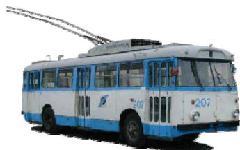
AS Tallinna Trammi- ja Trollibussikoondis oli ostude mahult suurim auditeeritu.

14. Äriühingute puhul on olukord teine, sest seadusandja on jätnud äriühingutele võimaluse ennast ise hankijana määratleda või jätta