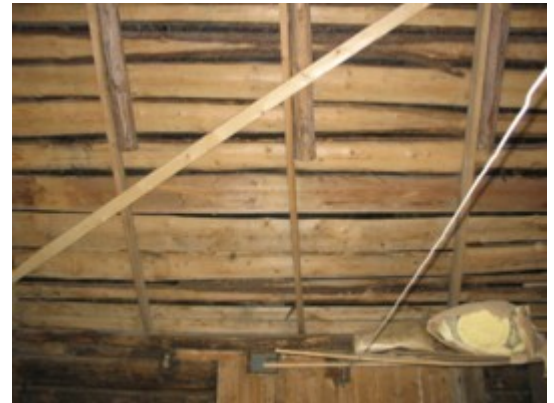
13: Lagunenud katuse ajutine toetus