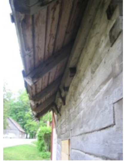
9: Lagunenud katuse ajutine toetus 10: Lagunev sein ja katus pargi poolt 11: Lagunev sein ja katus tee poolt