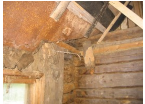
8: Pehkinud sarikate ajutine toetus