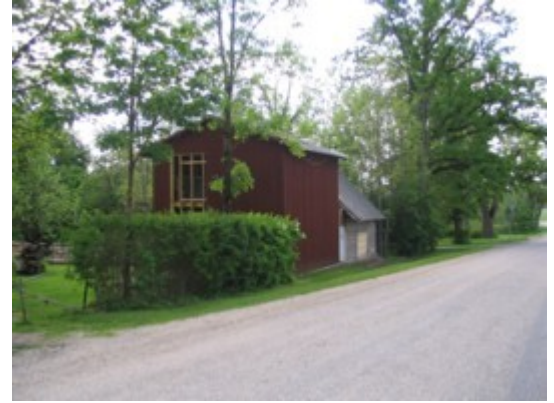
2: Vaade Palupera-Puka teelt linnumaja poole