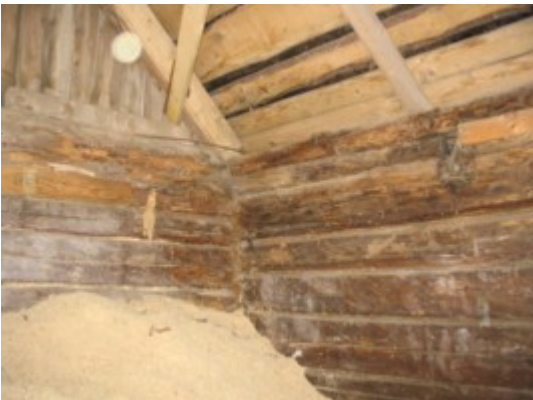
7: Amortiseerunud otsaseinad