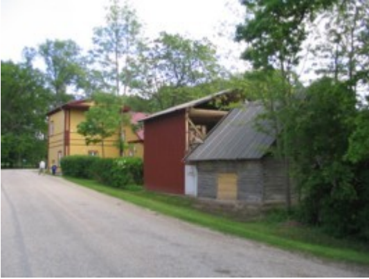
1: Vaade Palupera-Puka teelt kooli poole