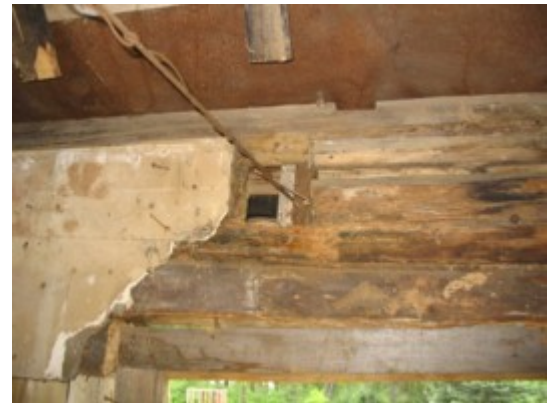
6: Tõmb palkseinte kooshoidmiseks