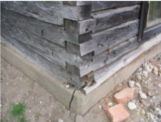
12: Lagunenud sokkel ja palkide nurgatapid