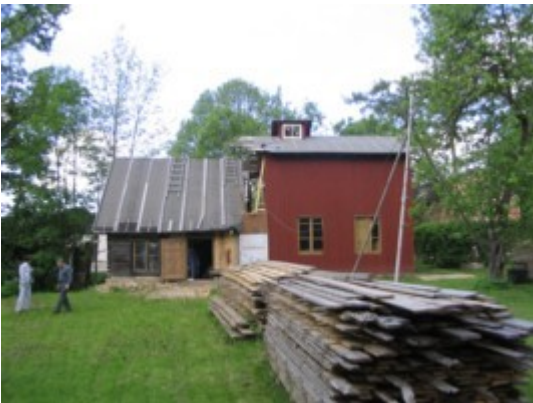
3: Vaade kooliaiaist sõidutee poole