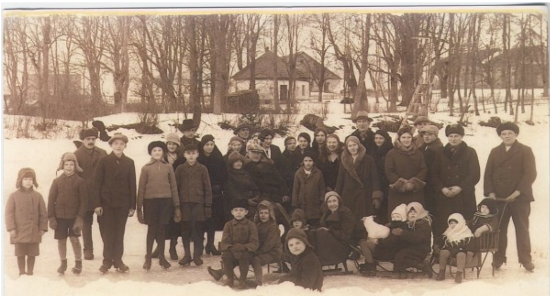
14: Foto umbes aastast 1935. Kuuri pildil veel pole.