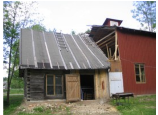
4: Vaade kuuri vanale osale kooliaiaist