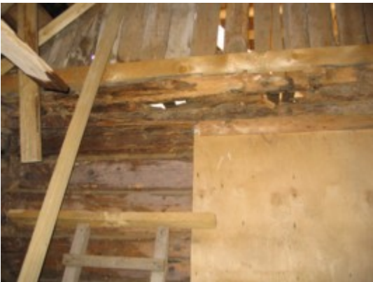
5: Amortiseerunud vahesein